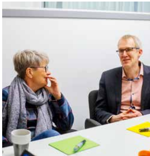
Deltagarna kände att de var överens om det mesta som handlar om stereotyper.