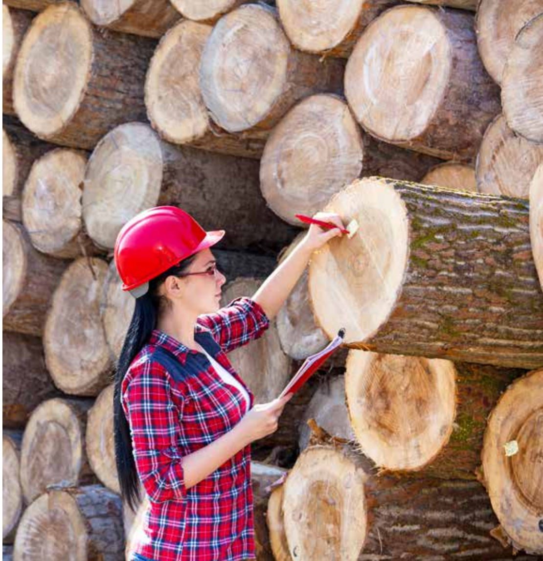
Genom att bryta dagens stereotypa mansroll skapas ett mer inkluderande skogsbruk.

organisationer och att fler söker sig till skogliga utbildningar. Men att öka intresset för dessa utbildningar är dock inte helt lätt då en anledning till att det är så få sökande beror på att allt färre unga har egen erfarenhet av att arbeta, eller ens vistas, i skogen idag.