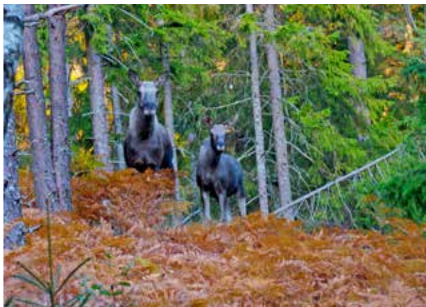
Forskarnas utmaning är att utveckla nya foder med bättre näringsbalans.