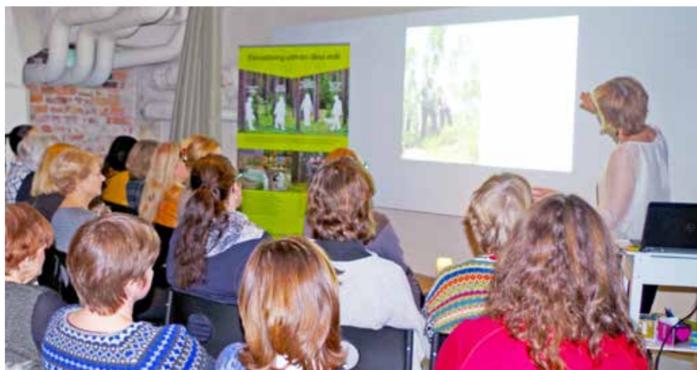
Många deltagare vid Skogssällskapets skogskvällar.

– Men innan vi körde igång kvällens program, presenterade vi Skogssällskapet, oss själva och vad vi kan hjälpa till med – vilket väckte nyfikenhet och ledde till vidare diskussioner under mingelpausen, säger Eivor.