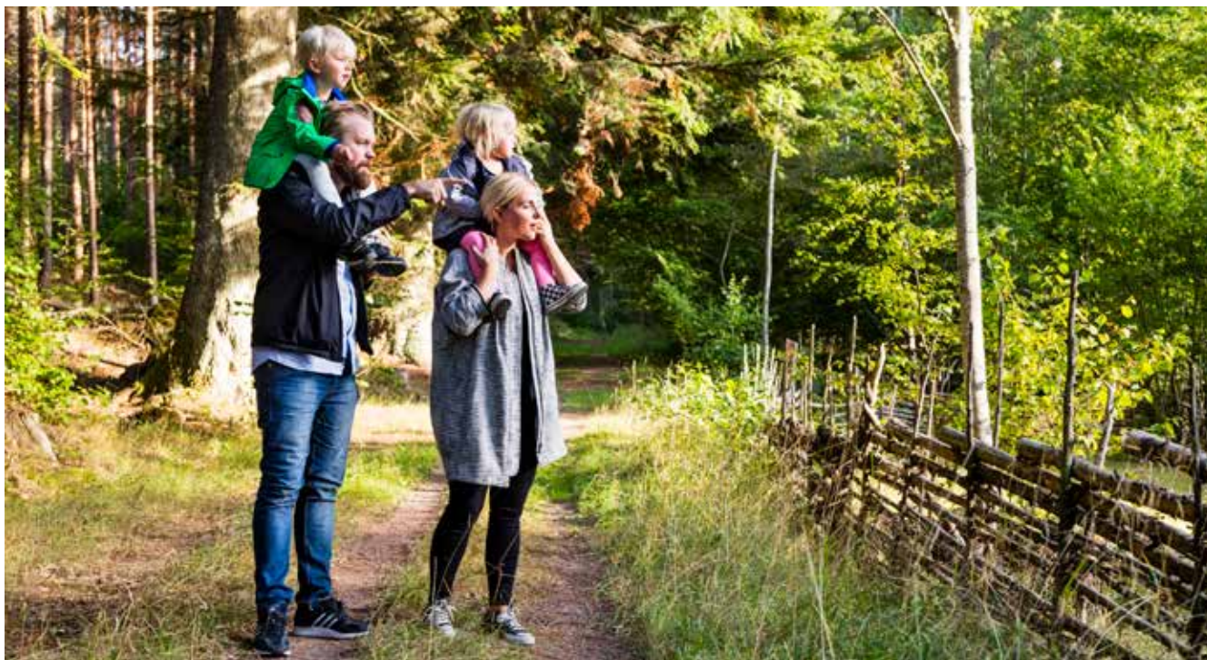
När den yngre generationen tar över ökar mångfalden i skogen.