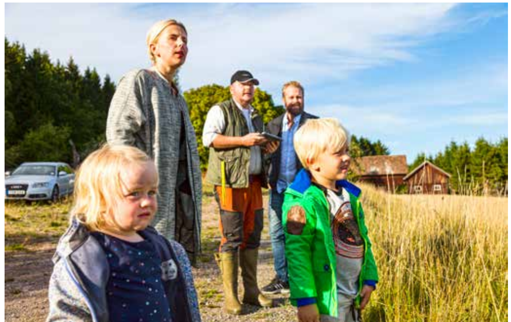
Det är klokt att i tid planera för generationsskifte i skogen.

– Med en uppdaterad skogsbruksplan och god